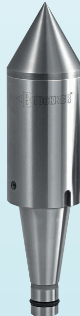
Steilkegel mit Vollhartmetall